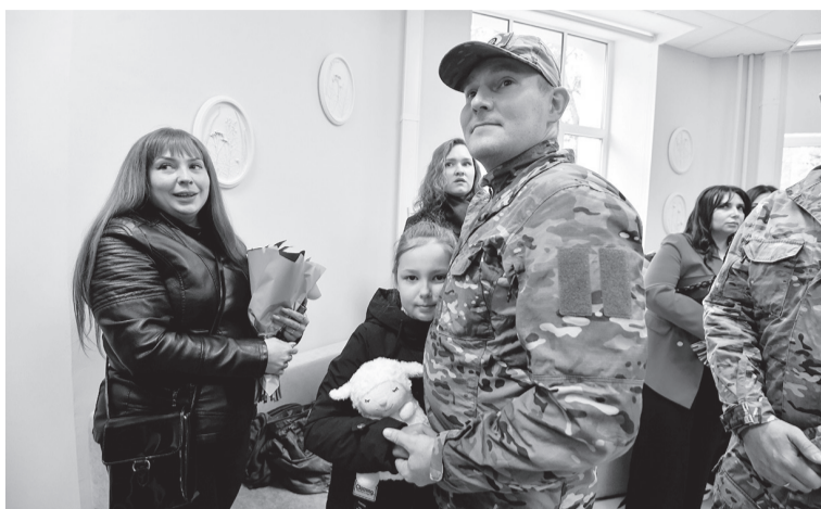
Фонд «Защитники Отечества» поддерживает ветеранов СВО и их семьи

Ленинградский филиал фонда «Защитники Отечества» приглашает бойцов СВО и членов их семей освоить новые специальности: «1С: Склад» и «Компьютерная графика».