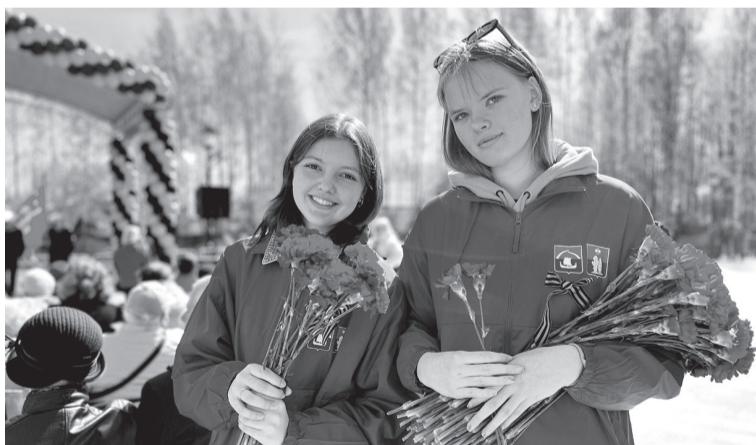
Волонтеры #МыВместе активно участвуют в патриотических мероприятиях

Уже больше года в Ленинградской области действует добровольческое движение #МыВместе. Мы неоднократно писали о том, как волонтеры помогают родным и близким наших защитников — будь то выполнение хозяйственных работ по дому, организация детского праздника или содействие в трудоустройстве. С недавних пор штаб движения определил несколько новых направлений работы. Подробности узнали журналисты «Ленинградской панорамы».