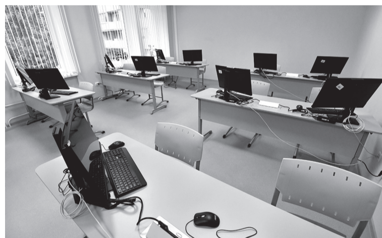
Занятия будут проходить в очном режиме на базе компьютерного класса

АЛЕКСЕЙ АСТАПЧИК ФОТО: МУЛЬТИЦЕНТР СОЦИАЛЬНОЙ И ТРУДОВОЙ ИНТЕГРАЦИИ